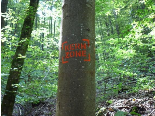
Wildnispark Zürich Kernzone-Markierung am Baum.

Bilder zum Download unter: www.wildnispark.ch/medien