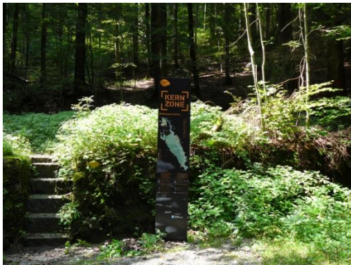
Wildnispark Zürich Stele der Besucherlenkung.