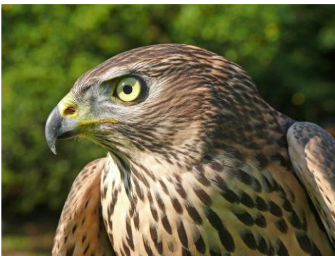
Greifvögel im Wildnispark Zürich Der Habicht - ein überaus wendiger Flieger.